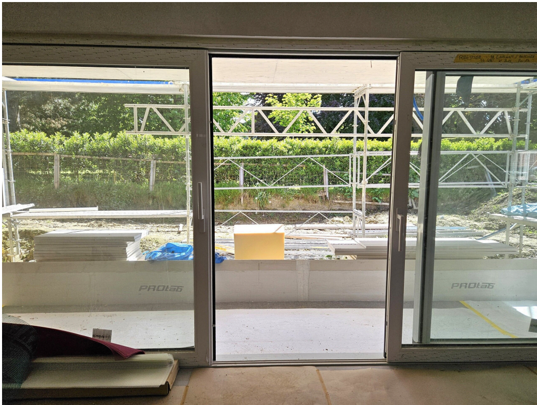
Vue sur terrasse