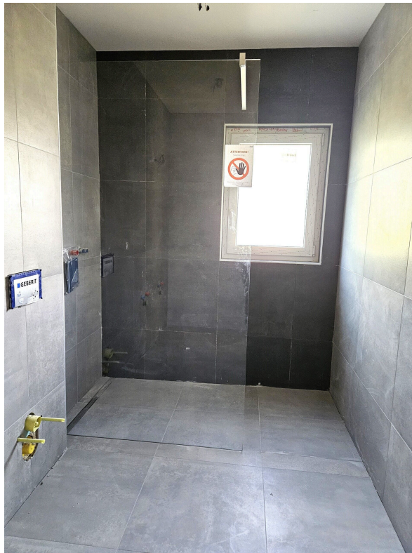
Salle de douche